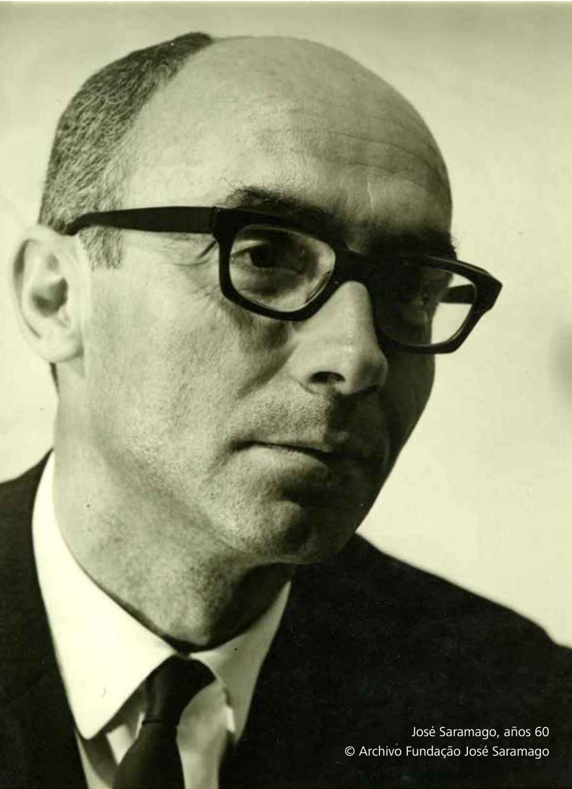
José Saramago, años 60