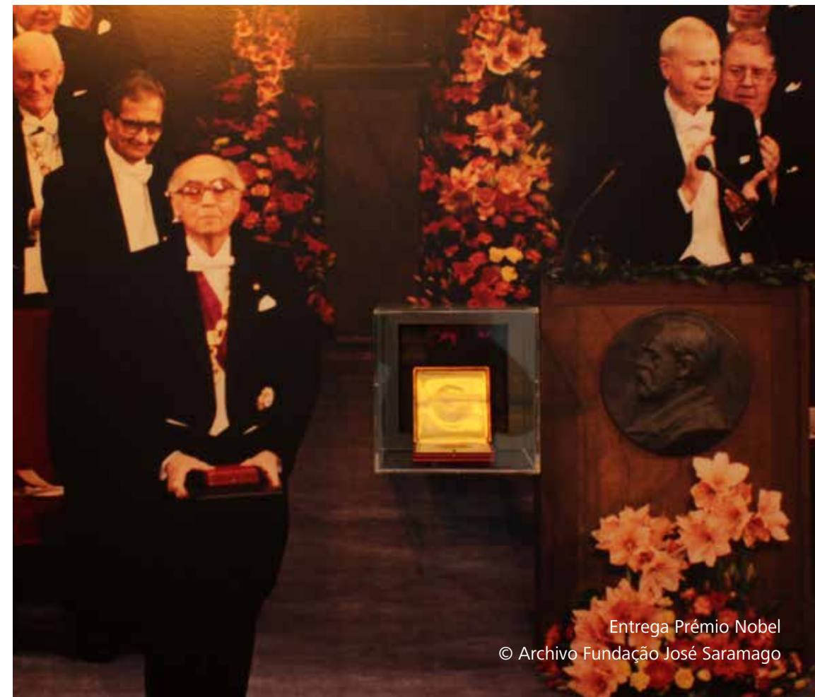
Entrega Prémio Nobel

Discurso pronunciado tras la entrega del Premio Nobel, 10 de diciembre de 1998