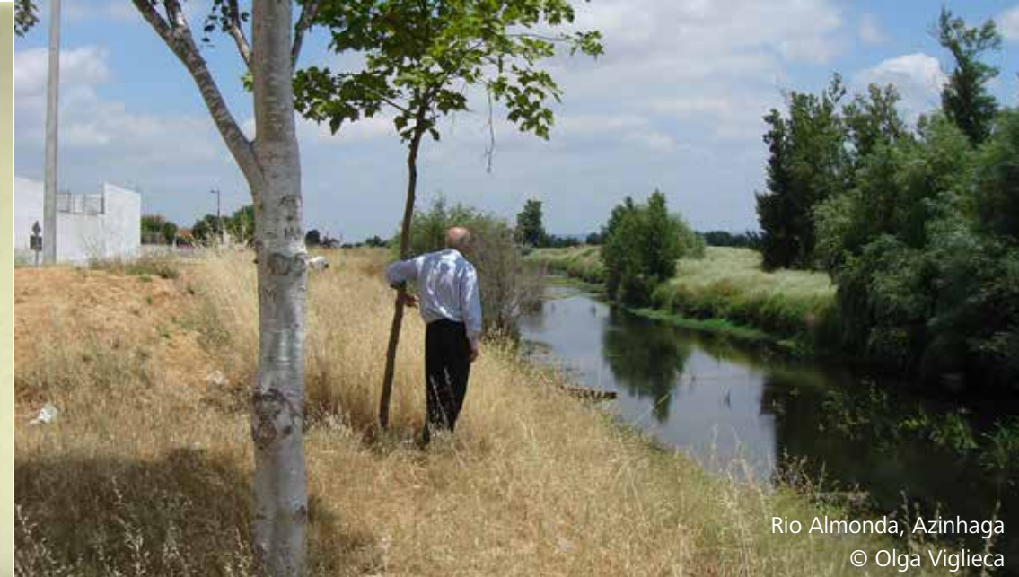
Rio Almonda, Azinhaga